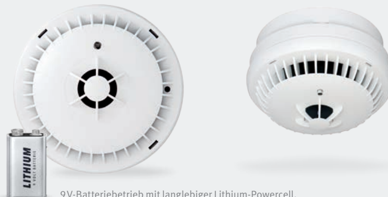
9V-Batteriebetrieb mit langlebiger Lithium-Powercell.

Ideal als Ergänzung zu Rauchwarnmeldern im Privatbereich.